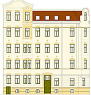
Untere Eichstädterstr. 5

Die Untere Eichstädterstraße liegt „on top“ in Stötteritz, dem höchst gelegenen Stadtteil Leipzigs im Südosten der Stadt. Bis hierhin schoben sich in der Eiszeit die gewaltigen Gletschermassen von Skandinavien. Der Stadtteil entstand aus zwei ehemaligen Gütern, von denen heute noch eines erhalten ist und als Kulturzentrum genutzt wird. Waldflächen, Grünanlagen und Parks schaffen ein optimales Wohnumfeld in Laufnähe zum berühmten Völkerschlacht-Denkmal.